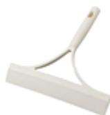
スクイージー（水切りワイパー）