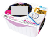
トイレ用掃除シート