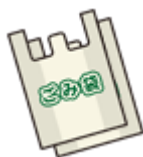
自治体指定ごみ袋