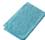
マイクロファイバークロス